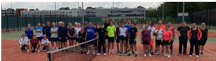
(Op pag. 8 meer foto's van deze geslaagde dag)